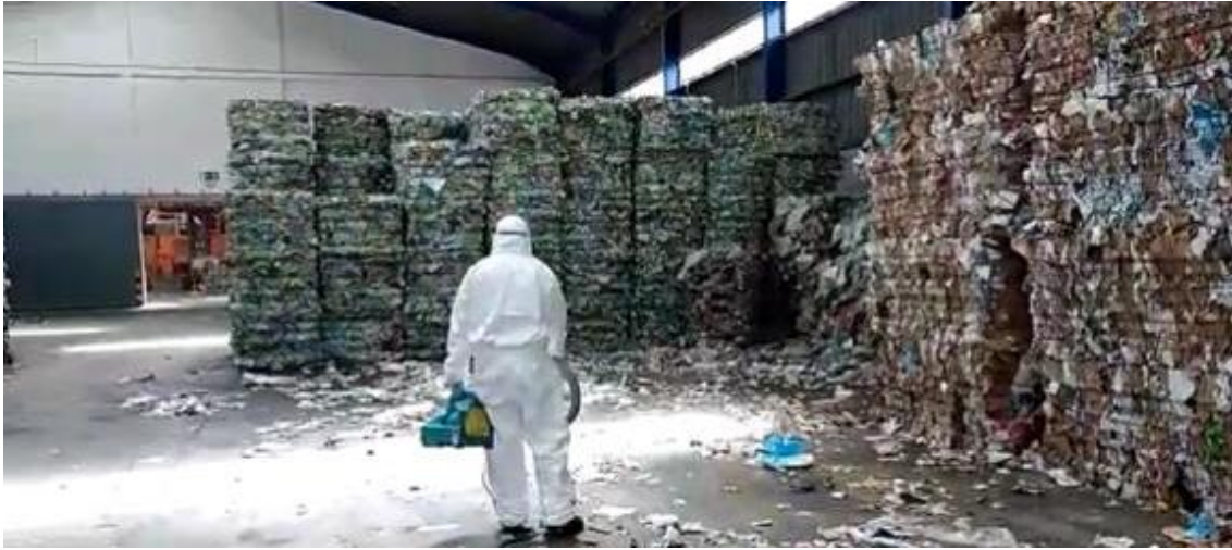
Interior da Central de Triagem de Embalagem