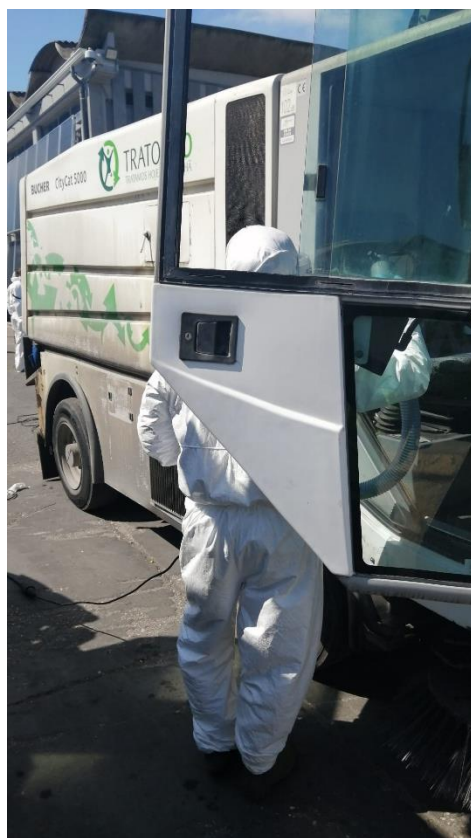
Limpeza e desinfecção de interior e exterior de equipamentos